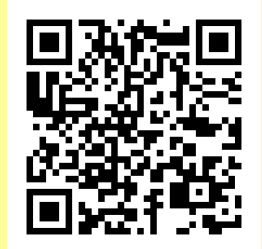
ひまわり相談ネット 佐賀県弁護士会