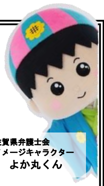
佐賀県弁護士会 イメージキャラクター よか丸くん